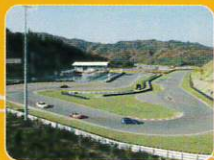
幸田サーキットyrp桐山

三河のあじさい寺と呼ばれる本光寺は、6月には約1万本のあじさいで彩られます。その他にも、四季折々の景色を満喫することができます。