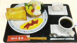
モーニングセット ~11:00

姉妹都市・長崎県島原市の特産品「そうめん」と「わかめ」幸田町の「長ナス」の贅沢なコラボレーション! 温冷選べます!